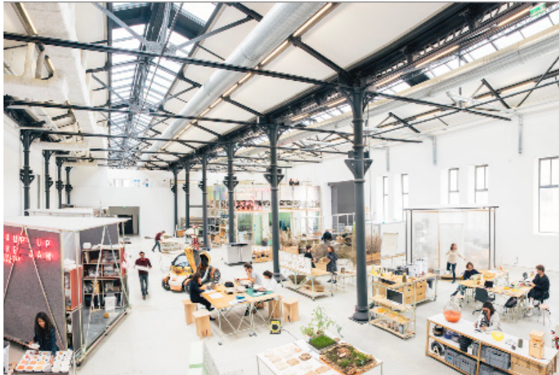
Atelier LUMA.