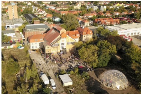
E-WERK Luckenwalde aerial nuotrauka, 2019.

Meno, rezidencijų ir edukacijos centras Rupert, bendradarbiaudamas su „E-WERK Luckenwalde“ ir „LUMA Arles“, pristato Europos Sąjungos finansuojamą projektą „tviri institucija“ – tarptautinių simpoziumų ciklą, menininkų rezidencijų programą ir instituciniam tvarumui skirtą skaitmeninių įrankių rinkinį. 2023 m. balandį-liepą visos trys institucijos pristatys po tarptautinio simpoziumo programą, orientuotą į tvarius ekonominius, humanitarinius ir ekologinius pokyčius. Simpoziumuose dalyvaus įvairių šalių menininkai, kuratoriai, kosmoso sociologai, ekonomistai, architektūros tyrėjai, antropologai, restauratoriai ir dizaino studijų atstovai, kurių tikslas – drauge sukurti pozityvią, tvarią kultūros sektoriaus transformaciją bei pateikti naudingų apčiuopiamų sprendimų.