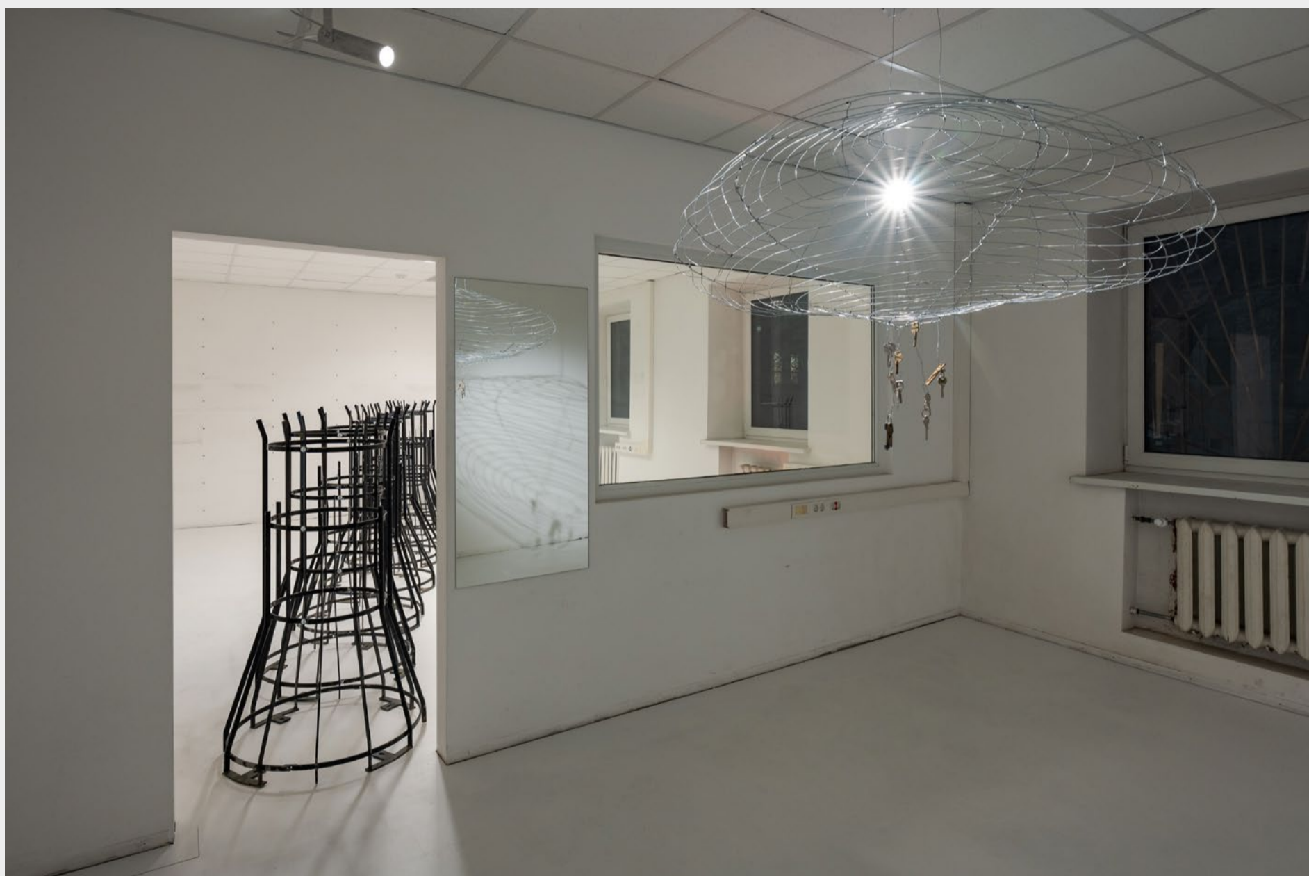
Églantine Laprie-Sentenac. „Sargybinis (Prašau, ne)“